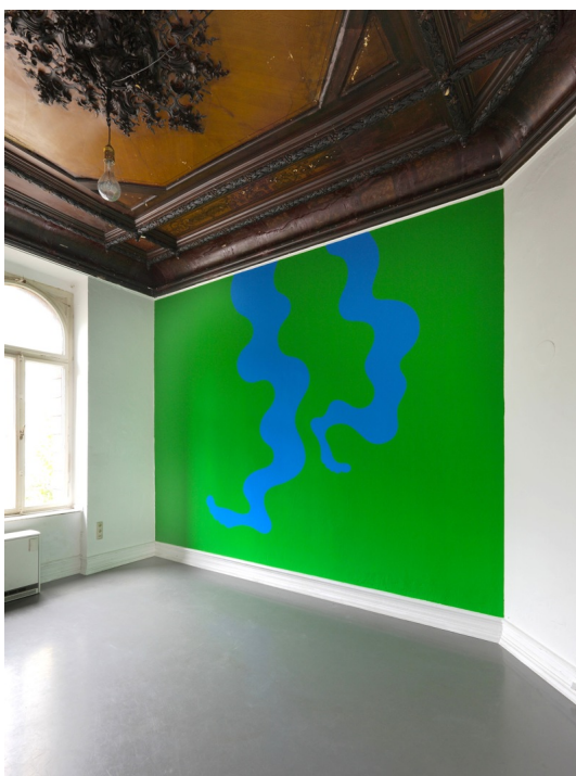
"Pharaos Dance", Wandmalerei, Jagla Ausstellungsraum Köln, 2014, Foto: Alistair Overbruck